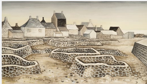
— Jan Zrzavý, Pole na Ile de Sein II. (vyvolávací cena 3 000 000 Kč)

JIŽ 3. PROSINCE 2016, RADISSON BLU ALCRON HOTEL PRAGUE