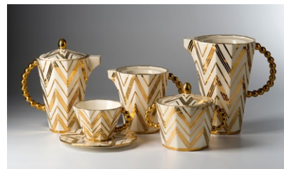
— Kubistický servis s kuličkovými oušky (vyvolávací cena 80 000 Kč)

Prosincová nabídka čítá celkem 737 položek, zastoupen je také historický nábytek, porcelán, sklo nebo vzácné zbraně. Více informací naleznete na www.dorotheum.com