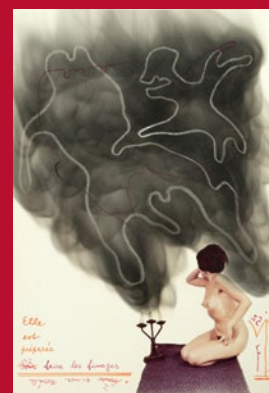
Ladislav NOVÁK líst Elle est préparé Vyvolávací cena 6 000 Kč