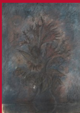
Alén DIVIŠ Kytice Vyvolávací cena 40 000 Kč