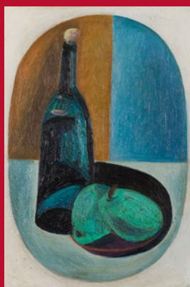
Karel ČERNÝ Zátíší s lahví a hruškami Vyvolávací cena 550 000 Kč