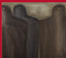
Květa VÁLOVÁ Poznamenání Vyvolávací cena 100 000 Kč